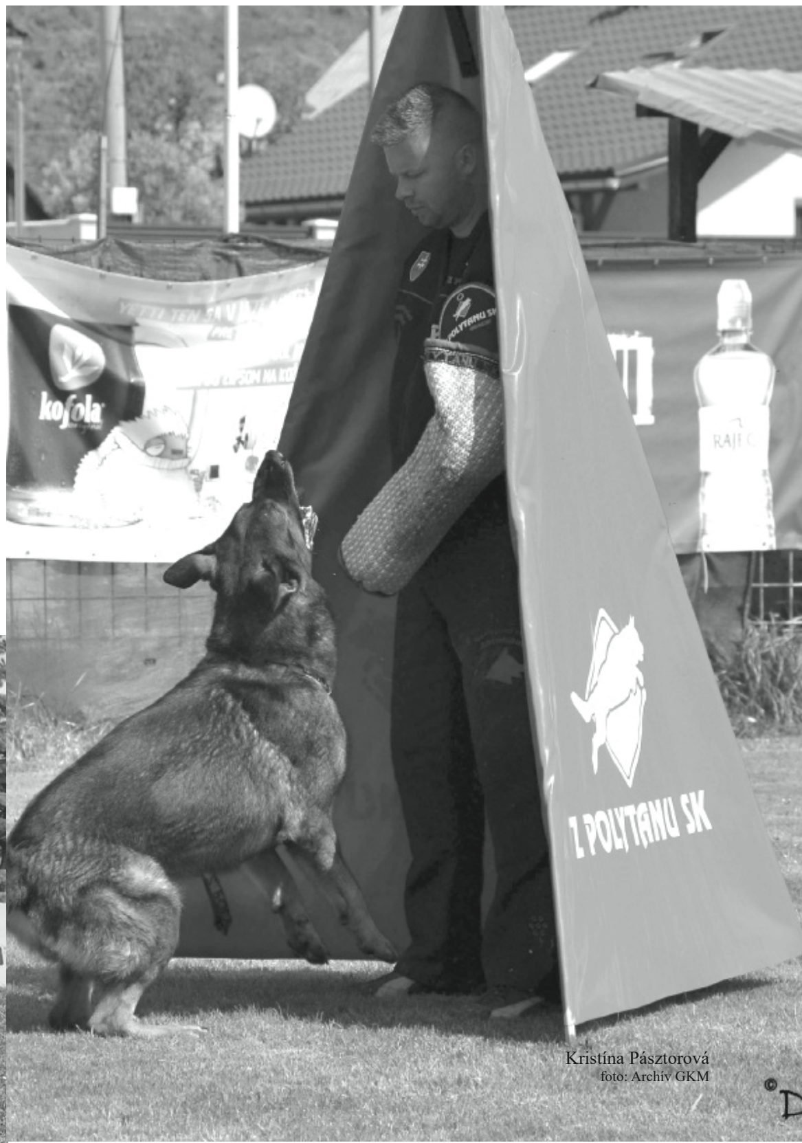
Kristína Pásztorová